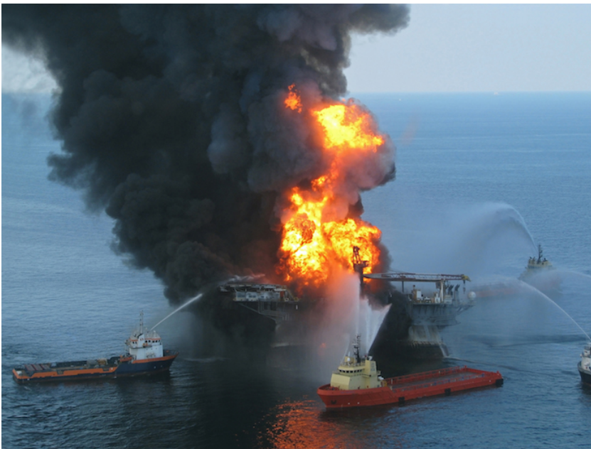
La plate-forme pétrolière Deepwater Horizon, dans le golfe du Mexique, le 21 avril 2010.

Mis à part la mobilisation militante, l'industrie offshore est aujourd'hui surtout préoccupée par le prix du pétrole. « Au prix actuel du baril, il n'y a aucun forage rentable », selon Achim Gertz, du collectif Objectif transition. Car le forage à des profondeurs toujours plus grandes (plus de 1.000 m pour l'offshore profond, 1.500 m pour l'ultraprofond) nécessite des installations résistant à la pression, et les plus sûres possibles. Ainsi, l'exploitation de certains champs pétrolifères offshore est gelée. Selon John Gove, participant à la conférence MCEDD, s'il est aujourd'hui possible de forer à 6.000 m de profondeur, cela n'est pas rentable à 35 dollars le baril. « Mais ça se développe déjà, malgré cette contrainte conjoncturelle. Et le prix va forcément remonter », analyse Julien Rochette, de l'Institut du développement durable et des relations internationales (Iddri) .